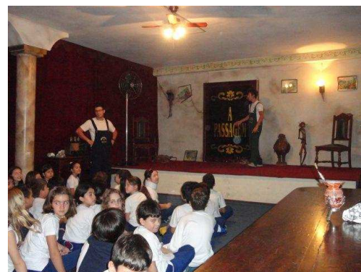
Biblioteca, cenário principal dos assustadores mistérios.