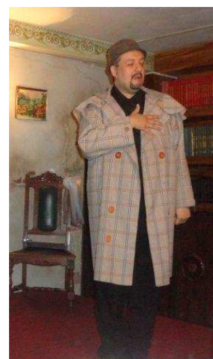
Xerox Holmes conta para as crianças sobre os acontecimentos na Cidade do Livro.