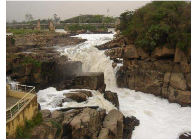
Queda d'água no Rio Tietê na cidade de Salto.