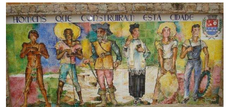
Painel em Santana de Parnaíba. Homenagem aos povos que ajudaram na construção da cidade.