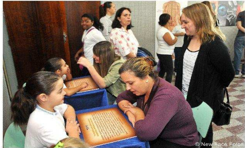
Sala dos 4ºs anos onde ocorreu a oficina com desafios ao cérebro