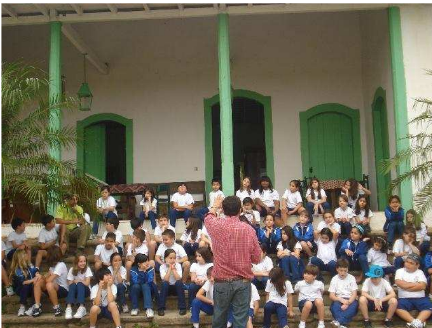
Alunos reunidos em frente à casa que pertenceu a Fernão Dias.

"Não quero passar com indiferença perto de ninguém!"